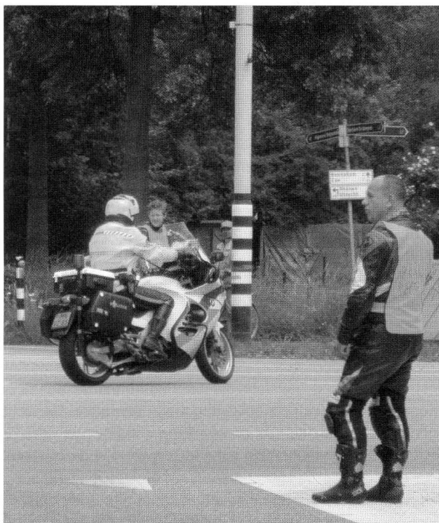
Bij evenementen, zoals bij wielertoernooien, werken politie en verkeersregelaars veel samen en vullen elkaar aan.

In 2011 was er ook contact met het NOC/NSF en met diverse sportbonden, zoals KNMV, KNWU, KNAU, KNVB, enz. Al deze bonden maken regelmatig gebruik van verkeersregelaars. Zij hebben er, zoals hiervoor reeds gememoreerd, groot belang bij om de organisatie rondom de theorie-instructies te vereenvoudigen. Ook is via NOC/NSF getracht om een subsidiering via diverse ministeries tot stand te brengen. Ook die pogingen mislukten.